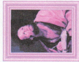
Lucas, geschilderd door Guido Reni (1621)

Nazaret was een kleine stad in het noorden van Israël. Het lag niet ver van het Meer van Galilea. Er gebeurden niet vaak belangrijke dingen in Nazaret. Toch ging de engel Gabriël juist daar op bezoek!