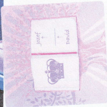
Jozef stamt af van koning David. Jezus is een 'Zoon van David', een koningskind.