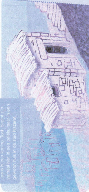
Jezus is een koning. Toch begint zijn verhaal niet in een paleis, maar in een gewoon huis in de stad Nazaret.